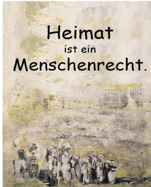
„Menschen, Landschaft, Flucht“ 9