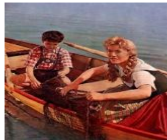
Die Fischerin vom Bodensee