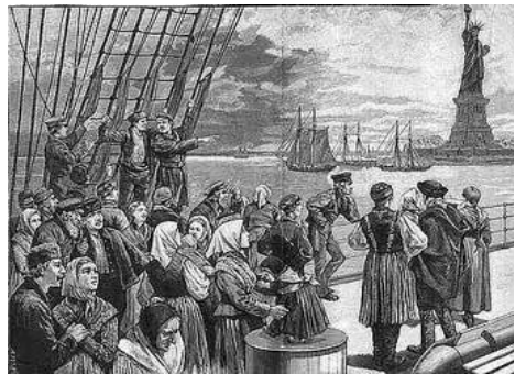
Ankunft im „gelobten“ Land