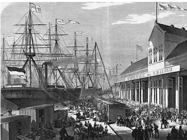
Columbuskaje Bremerhaven, Einschiffen 1870 15

Die Segelschiffe, mit denen die Menschen der ersten Auswanderungswellen bis etwa 1880 Deutschland verließen, waren eigentlich Frachtschiffe, die Waren von Amerika nach Europa transportierten. Auf dem Rückweg war der Platz frei für Auswanderer – für die Reedereien ein willkommenes Zusatzgeschäft. Die Auswanderer mussten als „Fracht“ mehrere Wochen dicht gedrängt unter Deck bleiben, oft ohne Tageslicht und Frischluft. In den Anfängen der Atlantiküberquerungen starben viele Passagiere an Bord.