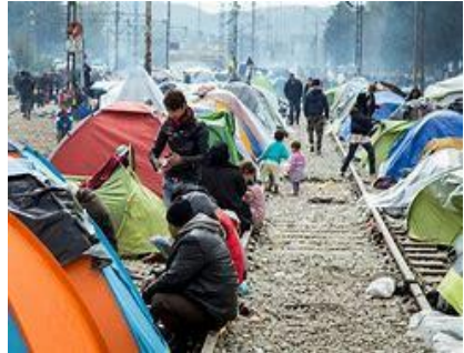
„Elend von Flüchtlingen“ 11