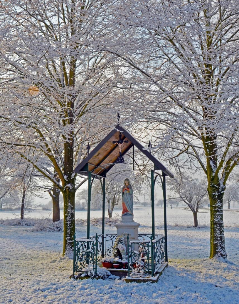
Marienstatue im „Winterzauber“