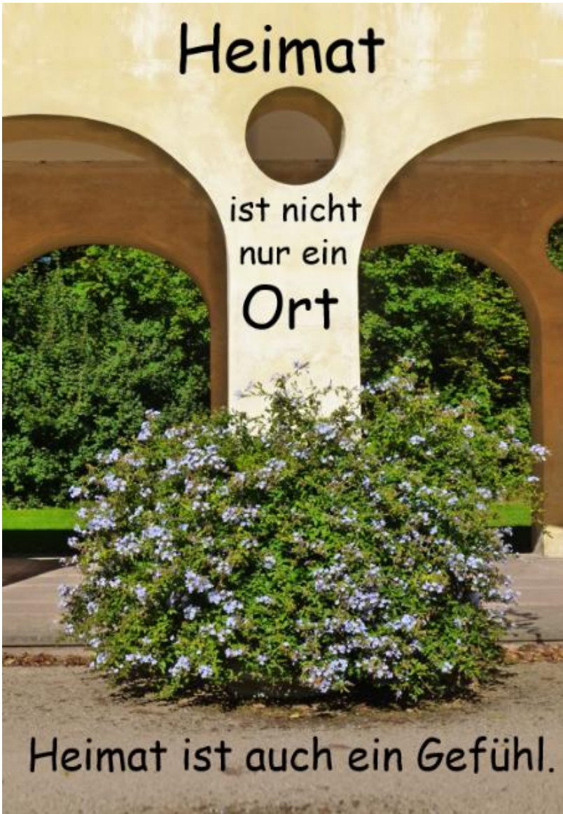
Seitlicher Arkadengang an der Orangerie zu Schloss Favorite