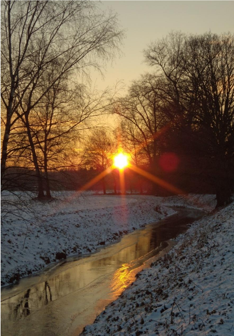
Winterstimmung am Ooser Landgraben beim Reisigplatz, fotografiert vor dem Tunnelbau