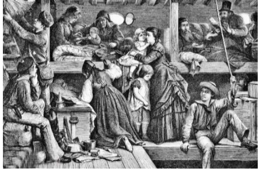
Quälende Enge auf einem Deck

Üblicherweise wurden für Schlafräume für vier erwachsene Personen nicht mehr als 1,80 mal 1,80 Meter veranschlagt.