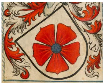
„Rose zu Eberstein“ 5

D´Eberschde Burg findet kein Navi-System, denn dort wird sie unter „ Alt-Eberstein “ notiert, ganz im Gegensatz zu „ Neu-Eberstein “, bzw. „ Schloss Eberstein “, welches hoch über Gernsbach das Murgtal „bewacht“.