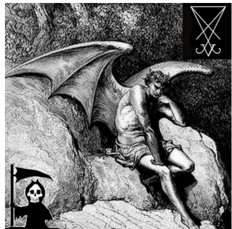
Teufel, Inbegriff der Bosheit 18

„Einst hatte sich ein Weisenbacher Müller, ein von Haus aus eigensinniger, immer polternder Mann, darüber geärgert, dass das Mühlwerk so ungünstig an der Murg lag. Bei Hochwasser erhielt es so starkes Hinterwasser, dass es aus und vorbei war mit dem Mahlen. Nach einem abermaligen Hochwasser, rief er voll Zorn: ‘Ich wollte, dass mir der Teufel eine Mühle auf dem Steinberg erbaue, die weder zu viel noch zu wenig Wasser hätte.’ Und kaum waren diese Worte gesprochen, als auch schon der Teufel vor ihm stand und sich bereit erklärte, seinen Wunsch zu erfüllen, doch nur unter der Bedingung, dass ihm der Müller auf ewig seine Seele verschreibe.