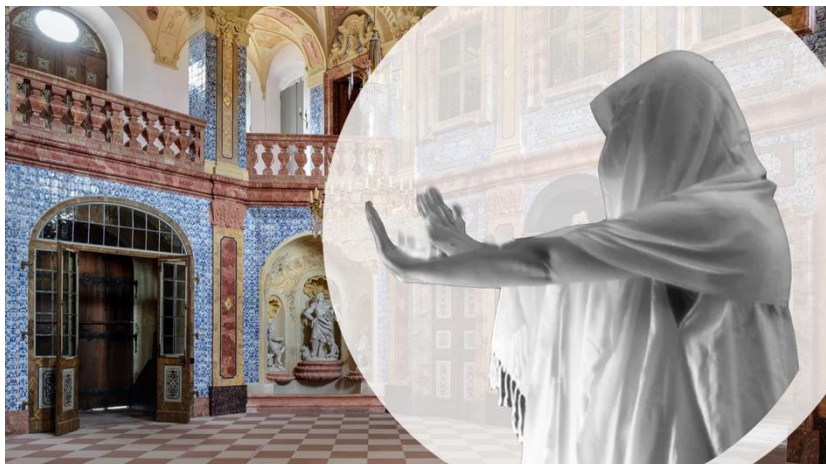
„Weiße Frau“ in dem Sala Terrena (Garten- und Festsaal) 4

Dass die „Weiße Frau“ nicht nur Todesbotschaften ankündigt, zeigt eine Variante, die nach Böhmen führt. In „ Volkssagen, Märchen und Legenden (1811) “ kann die „Weiße Frau“ auch die Geburt eines Kindes oder gar einen neuen Lebenspartner ankündigen.