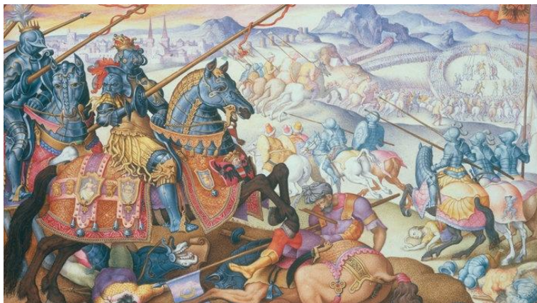
Kampf ohne Pferd – meist tödlich 12

Eine Ganzkörper-Rüstung, wie sie vor 600 bis 800 Jahren getragen wurde, bestand aus mehreren Metallplatten, die mit Riemen und Niete miteinander verbunden waren.