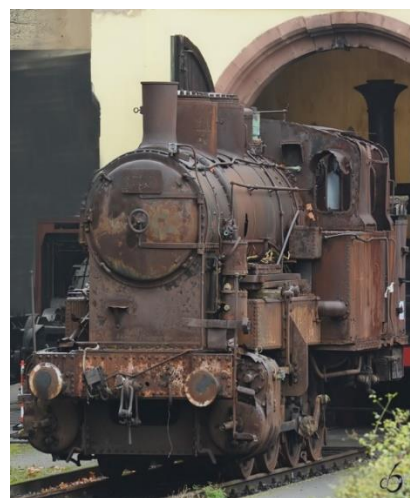
Dampflokomotive, Typ X b Nr. 175

Nebenstehendes Bild 3 zeigt die letzte erhaltene badische Dampflokomotive, ausgestellt im Eisenbahnmuseum Neustadt an der Weinstraße, Baujahr 1918.