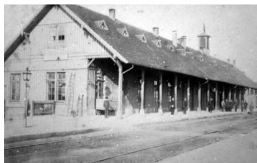
„Alter“ Rastatter Bahnhof im Stadtteil „Beinle“ 1

Mit dem Bau der neuen Bahnstrecke erhielt Rastatt 1844 seinen ersten Bahnhof. Dieser wurde fast 500 m weiter südlich des heutigen Standorts – nahe der Fa. Bizerba/ehem. Waggonfabrik – errichtet. Der Grund hierfür lag darin, dass die Festungsanlagen eine Streckenführung ins Stadtzentrum nicht zuließen.